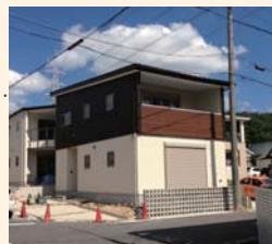
土地活用の一例(戸建賃貸)